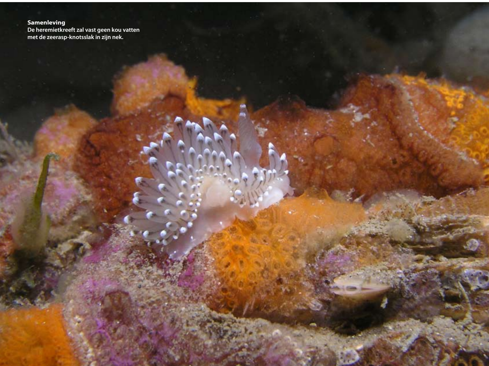
Samenleving De heremietkreeft zal vast geen kou vatten met de zeerasp-knotsslak in zijn nek.

zoals platvissen en grondels, die waren er zat. Trouwens, de zwarte grondel, is er ook niet altijd geweest, da's import. Nee, maar vissen als de zwartooglipvis, die leuke kleurige druk rondzwemmende vis met een schitterende