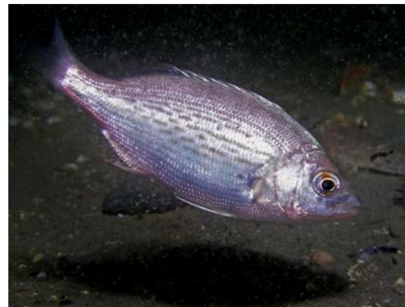
Ingesnoerd De binnenkant van de vrije-valboot, volledig in de gordels in een stoel.