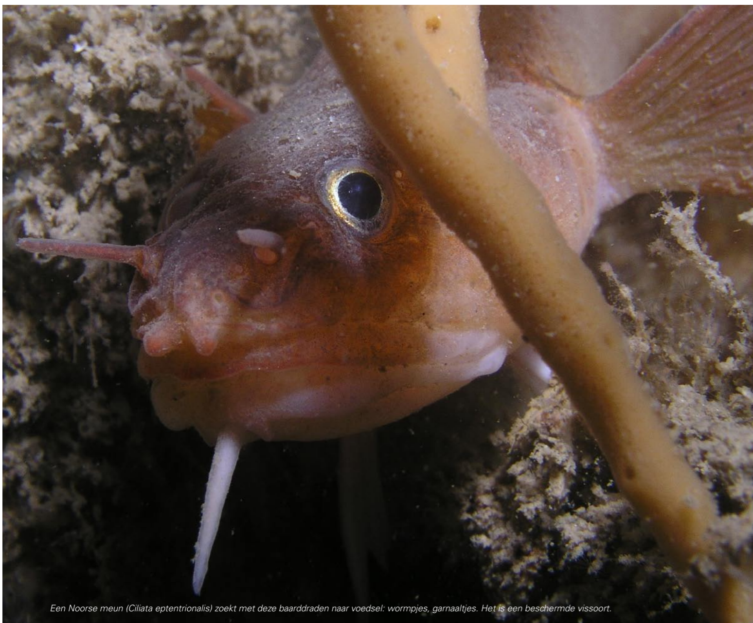
Een Noorse meun ( Ciliata eptentrionalis ) zoekt met deze baarddraden naar voedsel: wormpjes, garnaltjes. Het is een beschermde vissoort.